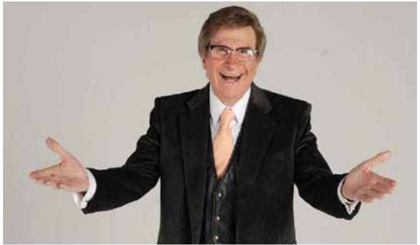
Silvio Soldán celebró el Día del Locutor en NTV.