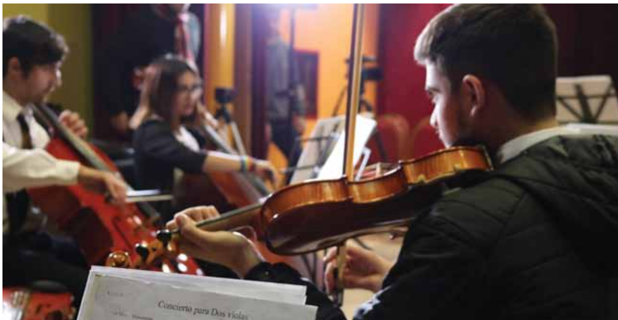
La Orquesta presentó el ensamble de una obra musical a distancia.