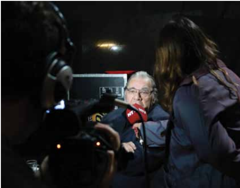
Enrique Pinti es uno de los humoristas más destacados de nuestro país.