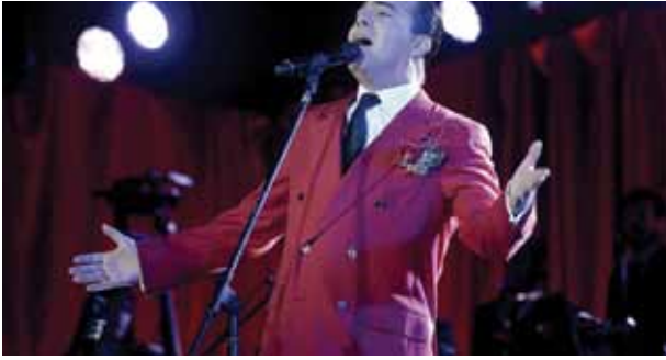
Cristian Castro en su show homenaje a Sandro.